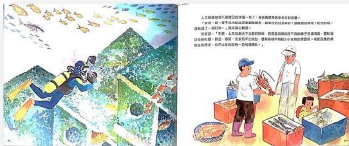
圖3 橫式紙張創作示意圖 (1組=兩頁)