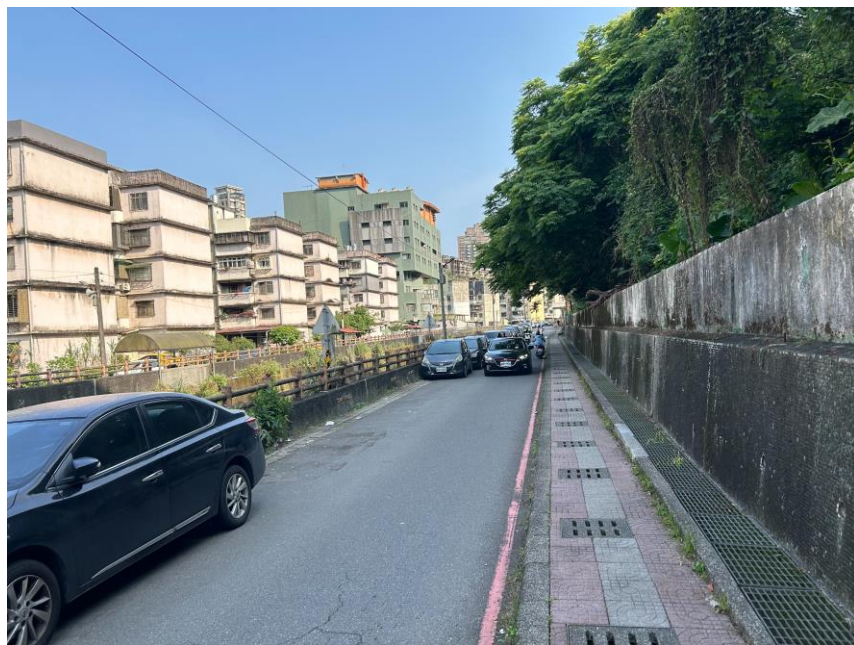
汽車進入後門行駛方向